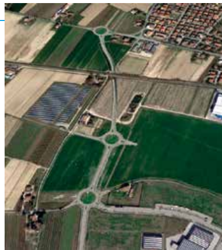
Rendering degli interventi tra la San Vitale e la A14Dir

“Si tratta di collegamenti fondamentali per Bagnacavallo e tutta l'Unione dei Comuni della Bassa Romagna - afferma il Sindaco Eleonora Proni - con conseguente aumento dell'attrattività del territorio, che a Bagnacavallo potrà inoltre essere ulteriormente valorizzato, in particolare nel