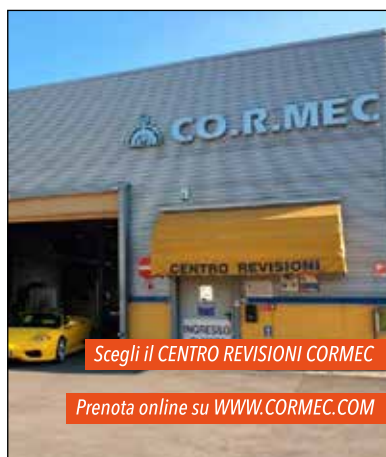
Scegli il CENTRO REVISIONI CORMEC

Il questionario è disponibile on line sul sito di CNA Ravenna: www.ra.cna.it