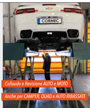
Collaudo e Revisione AUTO e MOTO