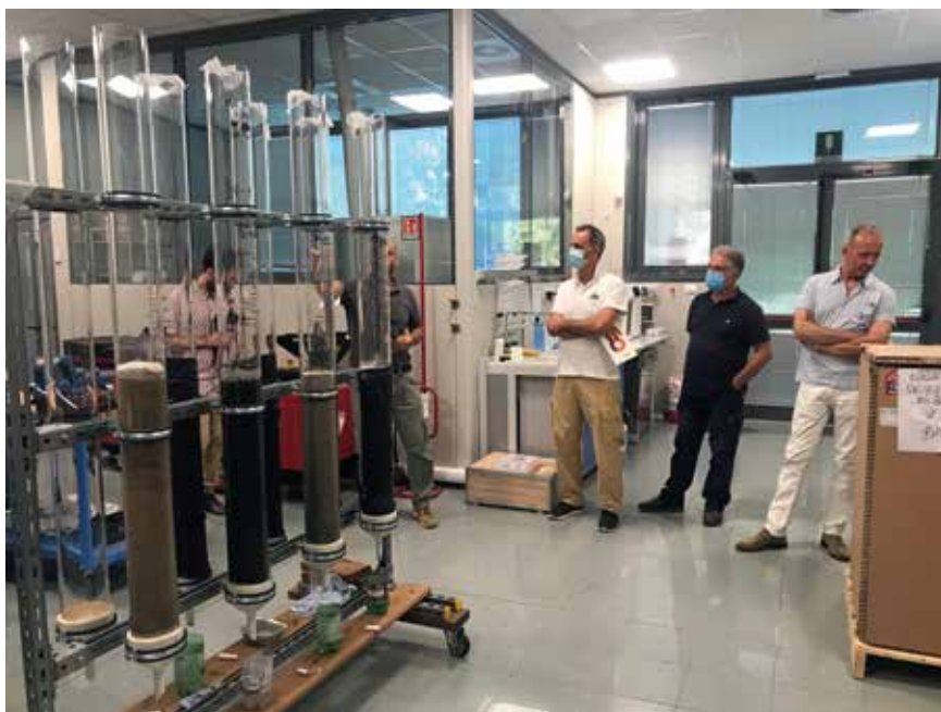
Una rappresentanza della CNA di Ravenna in visita al Centro Ricerche

L'intenzione è stata quella di conoscere le attività del centro, le sue potenzialità e le possibilità di collaborazione con il variegato sistema delle imprese associate alla CNA di Ravenna. Il Centro è parte del Tecnopolo di Ravenna, è dotato di tre laboratori, rappresenta una delle sedi principali per la realizzazione delle attività di ricerca sulle tecnologie per la crescita blu sostenibile e ospita attività di ricerca in collaborazione con il Fraunhofer Gesellschaft, uno de-