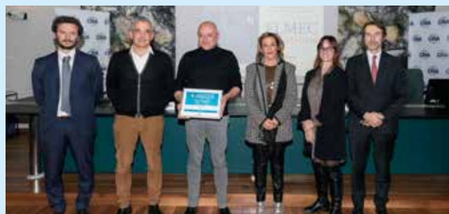
ELMEC - Faenza