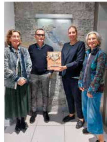
DML SpA (Faenza)