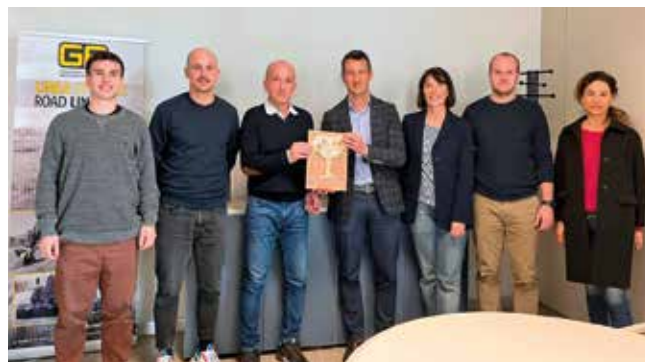
GF Gordini (Bagnacavallo)