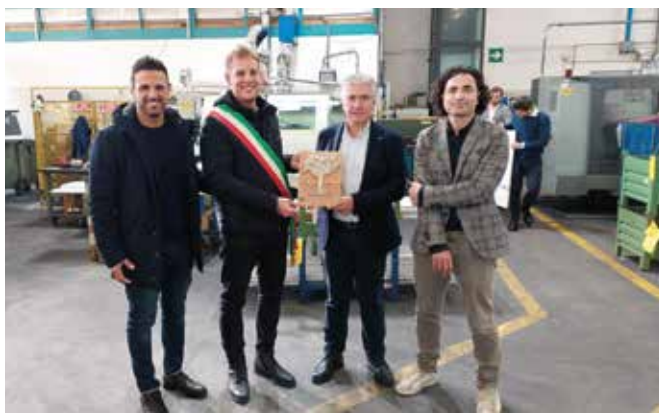
VG Sistemi (Castel Bolognese)