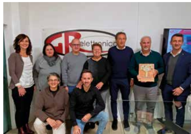
GR Elettronica (Lugo)