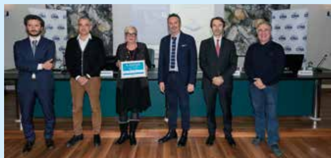
R.B.S. CONSULTING - Ravenna