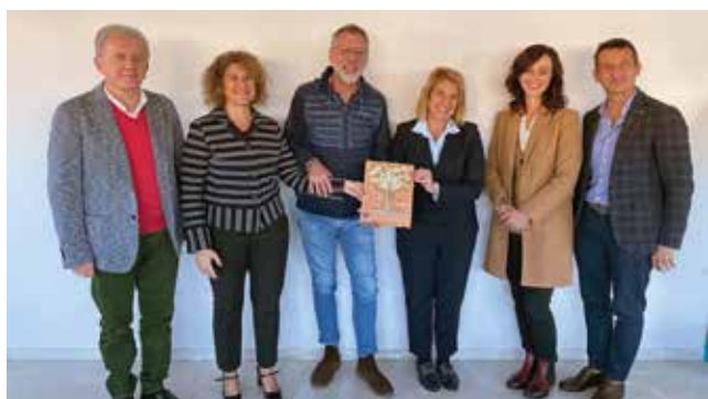
Ibix Cantieri (Lugo)