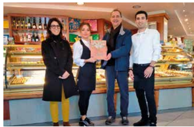
Dolci Peccati (Ravenna)