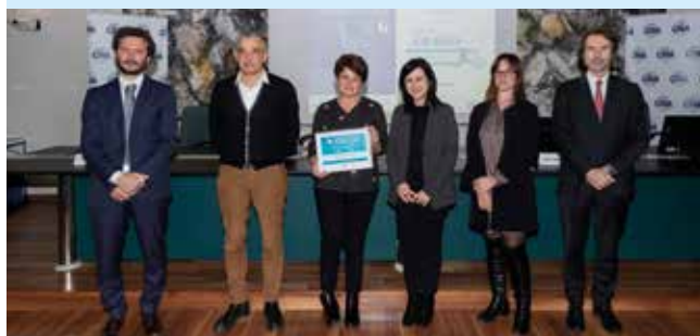
CORRIERE AMADEI - Faenza