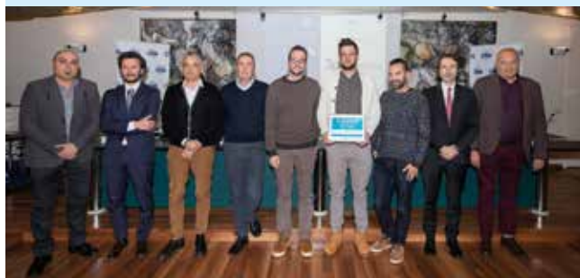
3PIX - Fusignano