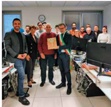
Poli Energie Srl (Faenza)