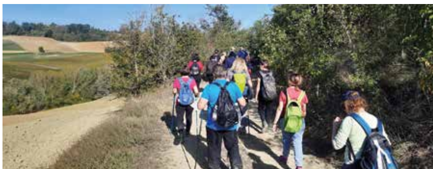
Un'escursione di Sentieri & Sapori nelle colline faentine

Numeri in crescita importante rispetto al 2021: +20,4% Faenza, +37,6% Brisighella, +28,6% Riolo, mentre ancora non si è recuperato il livello di presenze, inteso come pernottamenti, pre pandemia. Faenza si avvicina molto (-5%) mentre faticano ancora Brisighella e Riolo che sono ancora a -19%. Il settore, insomma, sta