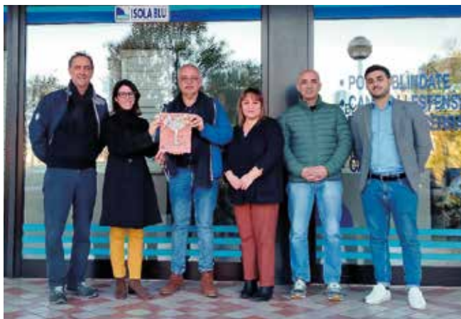
La Classeinfissi (Ravenna)