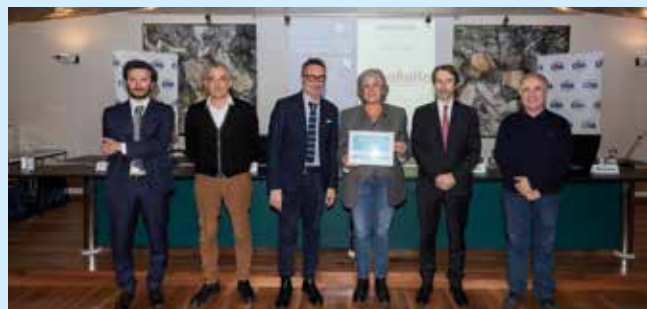
ANNAFIETTA - Ravenna