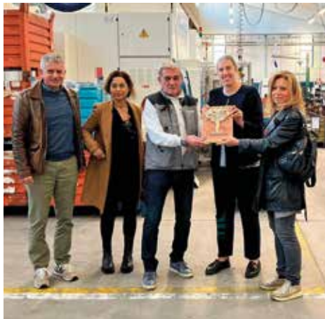
Torneria Meccanica Savini (Rusci)