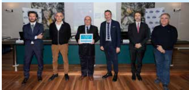
FI.DE.MA. - Ravenna