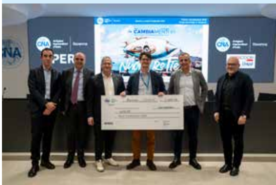
RAPCO2 - Prima classificata;

RAPCO2: ha sviluppato una tecnologia innovativa per la cattura e la valorizzazione della CO2 negli ambienti chiusi. La soluzione sviluppata dall'azienda non si limita a purificare l'aria indoor: cattura l'anidride carbonica prodotta dalla respirazione e la converte in prodotti chimici ed eFuel, con una capacità equivalente a quella di un intero ettaro di foresta in un solo metro quadro, e costi di rigenerazione ridotti a un terzo rispetto ai competitor. La gamma di prodotti prevede tre soluzioni scalabili — BlueLeaf, eJungle e la eRefinery — pensate per ambienti commerciali, uffici e impianti industriali, con l'obiettivo finale di produrre alcol isopropilico (IPA) direttamente dall'aria, un eFuel sicuro, non tossico e ad alto potere calorifico.