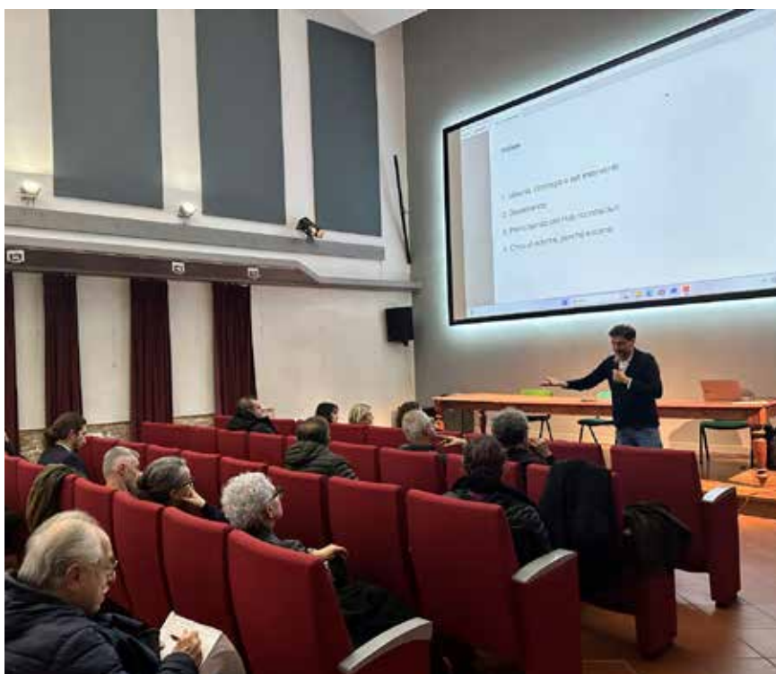
La presentazione del progetto alle imprese di Bagnacavallo

Il risultato atteso è l'avvio di un processo continuo di vera rigenerazione economica e sociale, capace di sostenere le imprese presenti nel perimetro dell'hub, le nuove forme di imprenditorialità e di consolidare una relazione virtuosa tra città