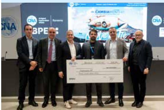
Aura - seconda classificata pari merito;

RAPCO2: ha sviluppato una tecnologia innovativa per la cattura e la valorizzazione della CO2 negli ambienti chiusi. La soluzione sviluppata dall'azienda non si limita a purificare l'aria indoor: cattura l'anidride carbonica prodotta dalla respirazione e la converte in prodotti chimici ed eFuel, con una capacità equivalente a quella di un intero ettaro di foresta in un solo metro quadro, e costi di rigenerazione ridotti a un terzo rispetto ai competitor. La gamma di prodotti prevede tre soluzioni scalabili — BlueLeaf, eJungle e la eRefinery — pensate per ambienti commerciali, uffici e impianti industriali, con l'obiettivo finale di produrre alcol isopropilico (IPA) direttamente dall'aria, un eFuel sicuro, non tossico e ad alto potere calorifico.