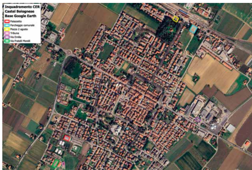
L'area interessata dall'intervento

Le superfici messe a disposizione sono sei: quattro parcheggi pubblici (in Via Emilia Levante, Via Fratelli Morelli, Via Santa Croce e Piazza Due Agosto) e le coperture di due impianti sportivi, il Palazzetto dello Sport di Via Donati e la tribuna dello Stadio Comunale di Via Fratelli Morelli.