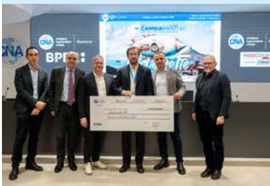
Totally innovation - seconda classificata pari merito

AURA: è una startup deep-tech che punta a rivoluzionare l'agricoltura di precisione combinando fotobiologia, IoT e intelligenza artificiale. La sua missione è trasformare l'illuminazione artificiale da semplice voce di costo a fattore di produzione dinamico e scientificamente ottimizzato, capace di massimizzare il benessere delle piante e l'efficienza delle risorse. Il cuore dell'azienda è la ricerca e sviluppo: Aura lavora alla creazione di "ricette di luce" dinamiche, protocolli basati su dati in tempo reale che, attraverso sperimentazione fotometrica e analisi algoritmica, traducono il linguaggio biologico delle piante in parametri di crescita misurabili e replicabili.